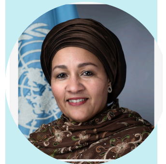
联合国常务副秘书长阿米娜·穆罕默德。可持续发展目标制定者。